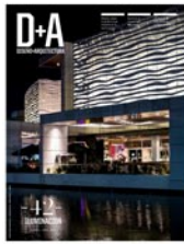
BLANKPAGE Arquitectos. Casa en el Líbano, in "D+A. Diseño + Arquitectura" (Chile) March/April 2015, pp. 58-63